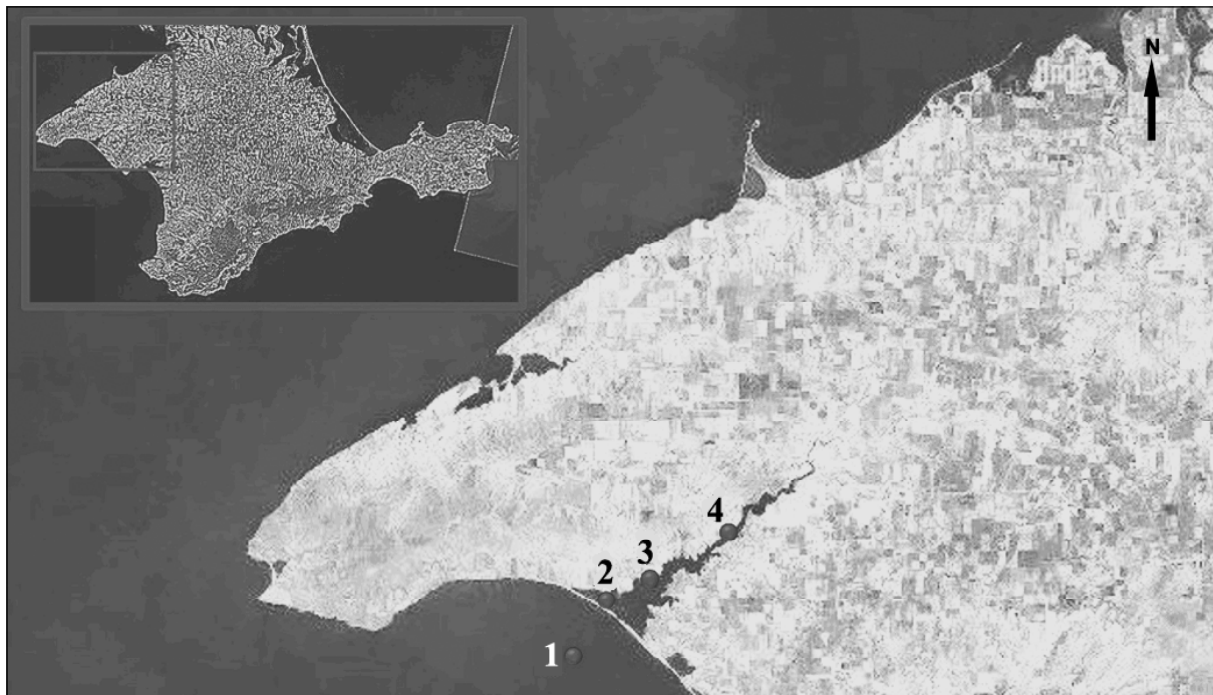
Рис.1. Карта-схема отбора проб донных отложений озера Донузлав

Попадание в одну из этих зон, наряду с доступностью и относительно равномерным распределением вдоль побережья озера, являлось важным фактором выбора местоположения станций пробоотбора. Полученный материал пополнит информацию о состоянии донных отложений этого уникального водоема. Отбор проб на каждой станции проводился трехкратно. Обсуждаемые показатели являются результатом обработки смешанных проб.